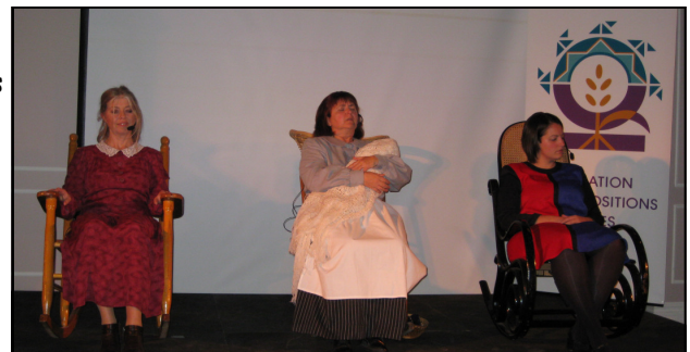
Troupe de théâtre les 2 masques