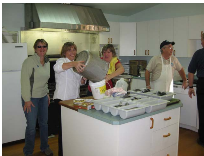
Dîner d'accueil de l'Exposition d'Ormstown, Club de curling

En terminant, nous désirons remercier l'exposition d'Ormstown pour son accueil chaleureux. Merci aussi à ceux et celles qui ont rempli le formulaire d'évaluation du congrès.